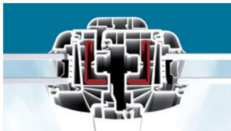
Coupe battement centrale fenêtre

e.VOLUTION atteint des performances optimales à tout point de vue, techniques et esthétiques, bien au-delà des exigences des réglementations les plus strictes. Elle améliore considérablement l'isolation phonique, l'étanchéité à l'air, à l'eau et au vent , tout en renforçant l'efficacité en matière de sécurité .